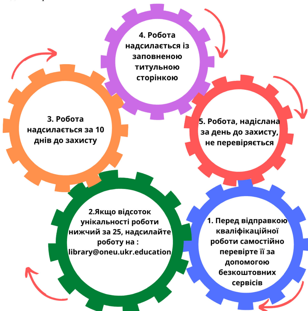
Рис. 1. Алгоритм перевірки кваліфікаційних робіт у Системі на унікальність

Схематично алгоритм завантаження кваліфікаційних робіт у Систему подано на рис. 1.